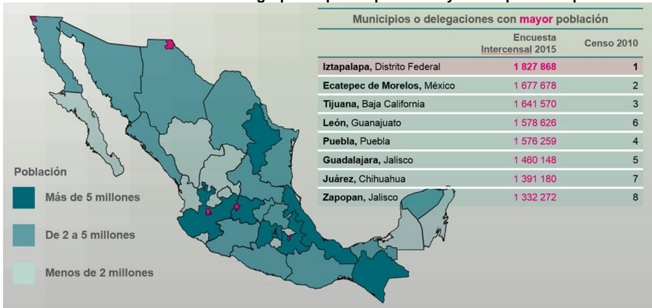
Cuadro 1. Entidades Federativas agrupadas por su población y municipios más poblados

La tasa de crecimiento de la población, que inicia su descenso a partir de la década de los 70's, por primera vez en 45 años no disminuyó y mantuvo el promedio anual de crecimiento de 1.4%.